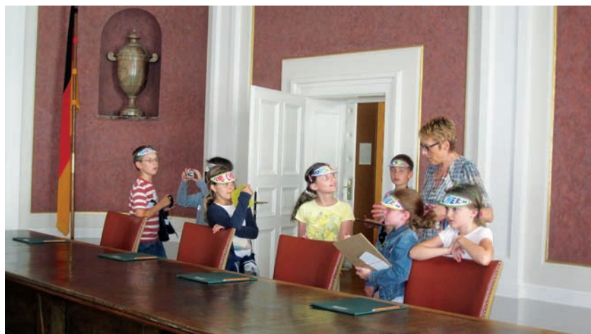
Kinder „entdecken“ die Richterplätze im Bundesfinanzhof

langfristigen Bündnispartner_innen, den Hort in der Reichenaustrasse, der Stadtteilbibliothek Westkreuz, dem Bildungslokal des Referates für Bildung und Sport und anderen Kooperationspartner_innen, die Bildungspotenziale im Westkreuz. Die Ergebnisse der Kinder werden aufbereitet und stehen allen entdeckfreudigen Personen im Westkreuz zur Verfügung. Dabei werden verschiedene Medien eingesetzt. Was es an Bildungsgelegenheiten gibt, kann man sich mit Hilfe bekannter Medien als Stadtteilrallye, als Aus-