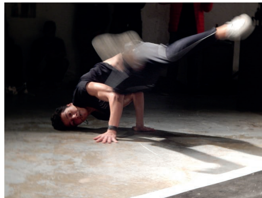
Break Dance (Kulturcafé)

2013 blickt IMAL zurück auf 18 Jahre Jugendarbeit. Jugendarbeit, die es sich zum Ziel gesetzt hat, Dinge neu und anders zu denken, zu experimentieren, innovative Ansätze zu finden. Jugendbildungsarbeit , die Bildung, Kunst, Kreativität, Lebensbewältigung vereint und eine gesellschaftliche Teilhabe, einen Ausgleich von Defiziten ermöglicht, indem sie an den Stärken ansetzt. Basis war immer