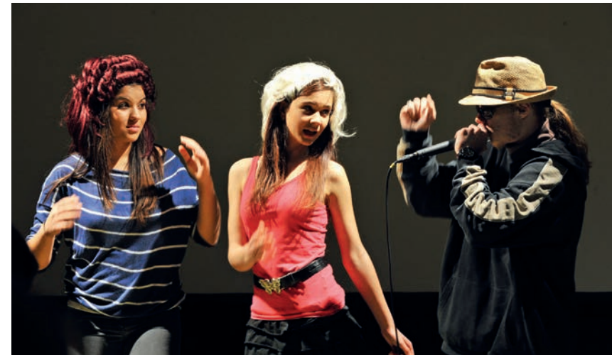
„Soul Selling“, Du bist ein Model so superzart, Studio Mufathalle

Das Modellprojekt „Arts Education“ erweitert schulische Bildungsmöglichkeiten im Einklang mit dem Selbstverständnis von Kunst und Jugendhilfe