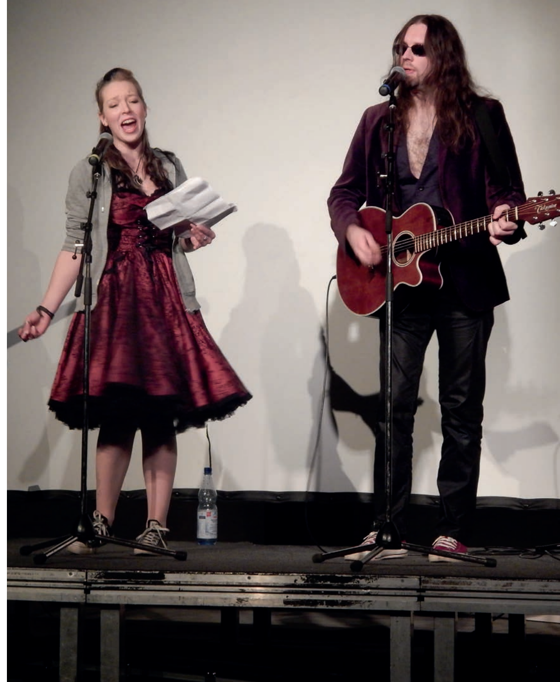
Rockband (Kulturcafé, Lamentohalle)

Kulturreferent der Landeshauptstadt München wertet die Bedeutung kultureller Bildung für München als groß. Kinder und Jugendliche erhalten dadurch attraktive Experimentierräume, die auch weiterhin bestehen sollen. Eine über die kommunale Ebene hinausgehende Bildungsdiskussion – wie mit dem Netzwirkongress „Banlieues d'Europe“ initiiert – ist notwendig und zeigt die europäische Dimension der Debatte.