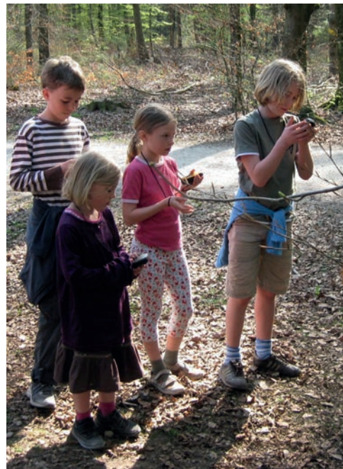
Kinder beim Geocaching

daran eröffnen und neue Zugänge zur Lebensumwelt und ihrer Mitgestaltung ermöglichen.