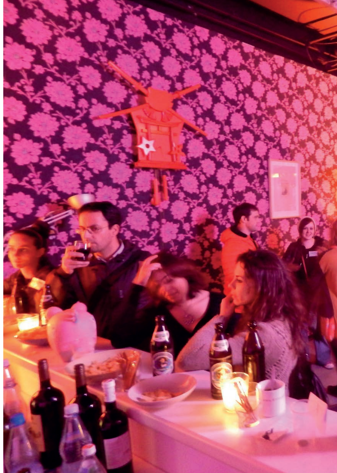
Kulturcafé, Lamentobar