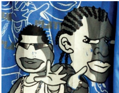
„Borders“, Mo's T-Shirt, Bosnien

Das Institut für Angewandte Kulturelle Bildung strebt an, aus dem Modellprojekt ein internationales „Centre for Community Arts“ mit den oben genannten inhaltlichen Schwerpunkten zu entwickeln. An diesem können pädagogische Einrichtungen, Projek-