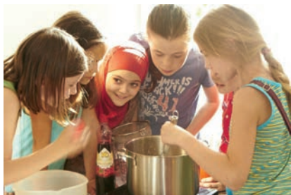
Bubble Tea für die Redaktionsmitglieder

engagiert haben, z. B. Jugendliche, die ihren Schulhof verschönern oder sich für den Erhalt ihres Bolzplatzes einsetzen oder Schüler_innen vorzustellen, die sich um das Mensaangebot ihrer Schule kümmern.