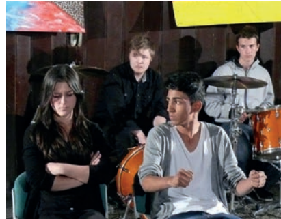
„Borders“, Beziehungszeit auf der Autobahn, Bosnien