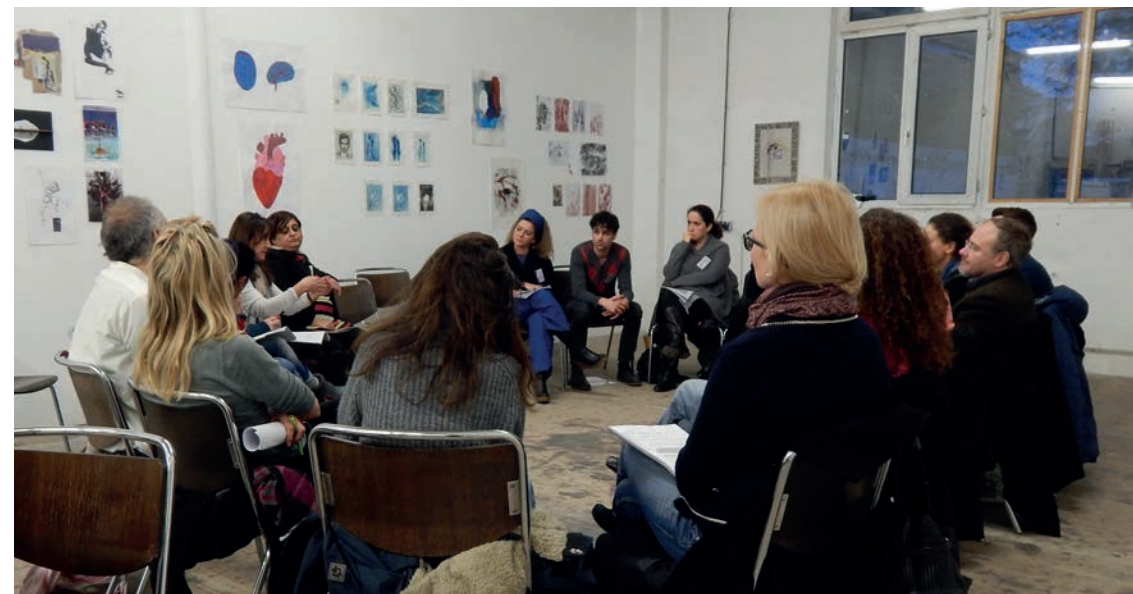
Diskussions- runde beim 20. internatio- nalen Kongress des Kulturnetz- werks „Banlieues d’Europe“ (siehe Seite 6)